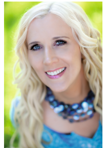
Josefa Schmid 1. Bürgermeisterin